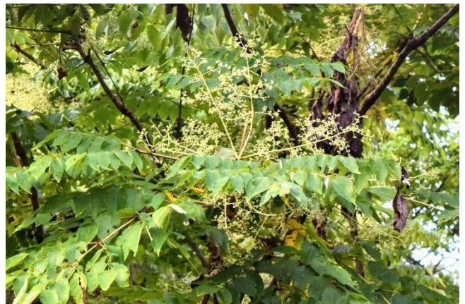
m DSC_4261-EDIT タラノキの美 R05.08.26AM0528 N.jpg