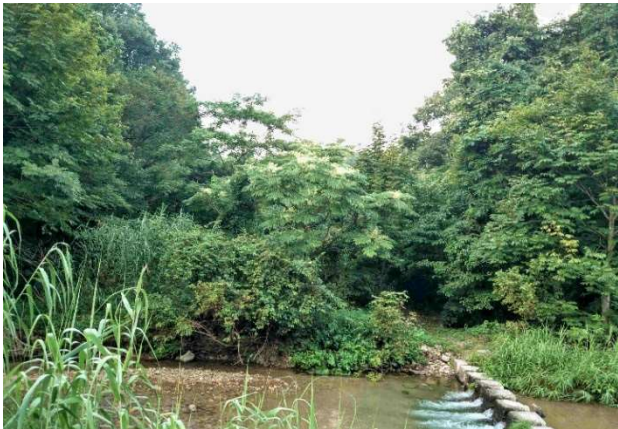
m DSC_3629 タラノキの白美 R05.08.26AM0531 S.jpg